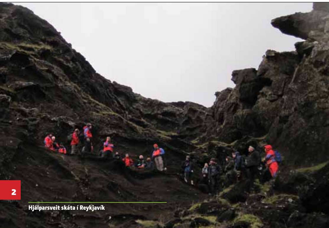
Hjálparsveit skáta í Reykjavík